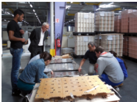
Visite de l'entreprise Autajon Cartonnages